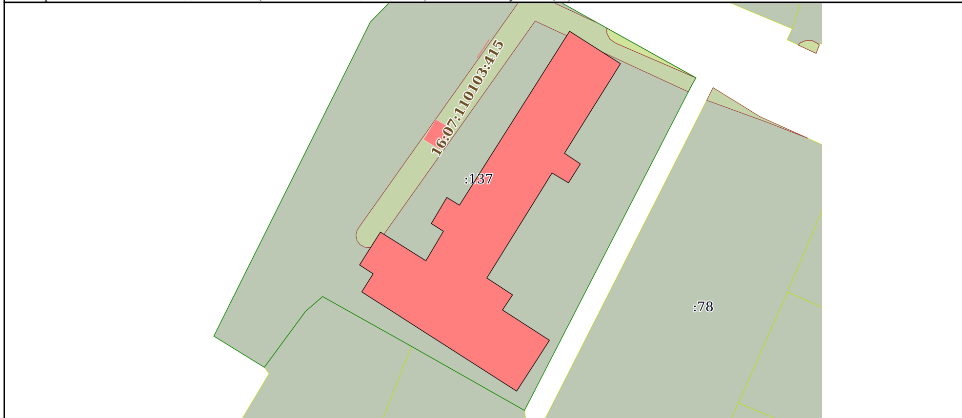
Схема расположения объекта недвижимости (части объекта недвижимости) на земельном участке(ах)